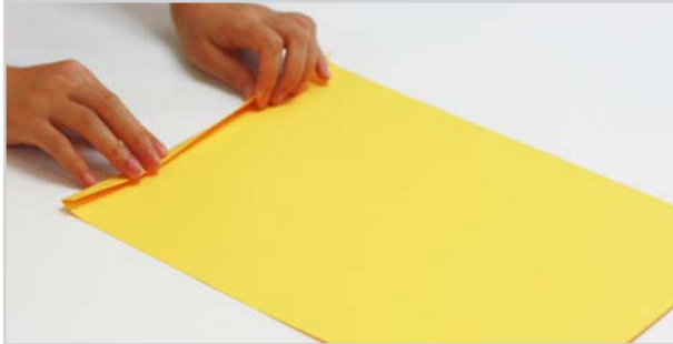
① 8절 색상지의 세로 부분을 약 1cm 가량 접습니다.