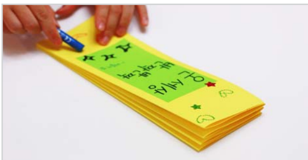
⑦ 책을 잘 접은 다음에 책의 앞 표지와 뒤 표지를 예쁘게 꾸밉니다.