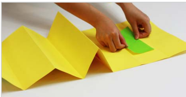
⑤ 색종이를 잘라서 책의 각 페이지에 붙입니다. 이때 색종이는 상하 좌우로 약 1cm 정도 여분이 남도록 책 크기보다 작게 자릅니다.