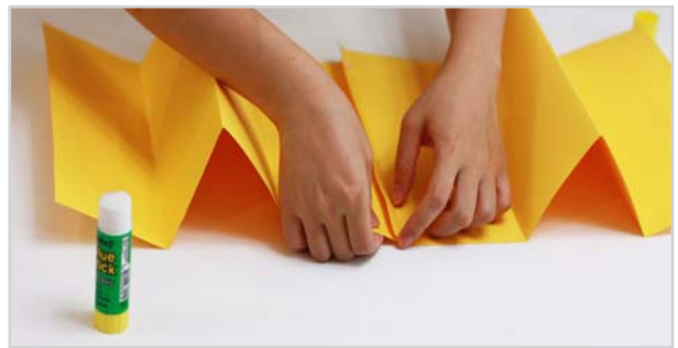
④ 각 종이 끝 1cm 가량 접힌 부분에 풀칠을 하고 두 장의 종이를 붙입니다.