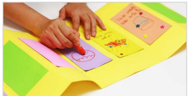
⑥ 색종이에 여러분이 발견한 반짝이는 것들을 담습니다. 그림으로 그리거나 반짝거리는 꾸미기 재료를 이용해도 좋습니다. 단, 양 끝 페이지는 각각 책의 앞 표지와 뒤 표지이므로 그대로 남겨 둡니다.