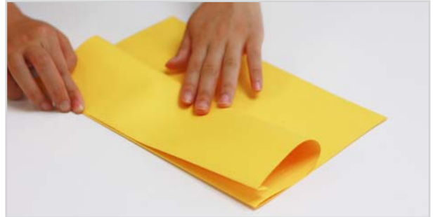
② 끝이 접힌 상태로 종이를 반으로 접은 다음, 종이를 펼쳤을 때 지그재그 모양이 되도록 다시 바깥쪽으로 한 번 더 접습니다.