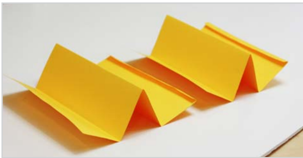
③ 다른 8절지도 이와 똑같이 접습니다.